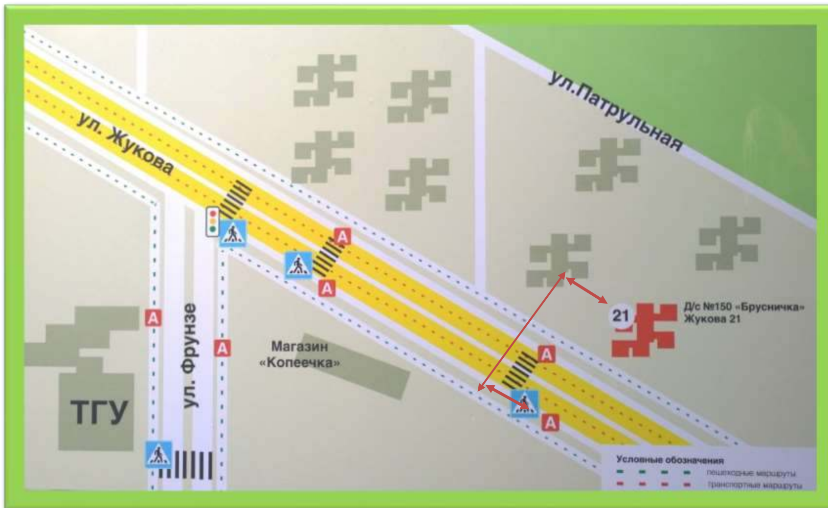
Схема расположения детского сада №150 «Брусничка АНО ДО «Планета детства «Лада» с указанием безопасного маршрута движения воспитанников по регулируемому и нерегулируемому пешеходным переходам

2. Схемы организации дорожного движения в непосредственно близости от детского сада с размещением соответствующих технических средств, маршруты движения обучающихся и расположение парковочных мест